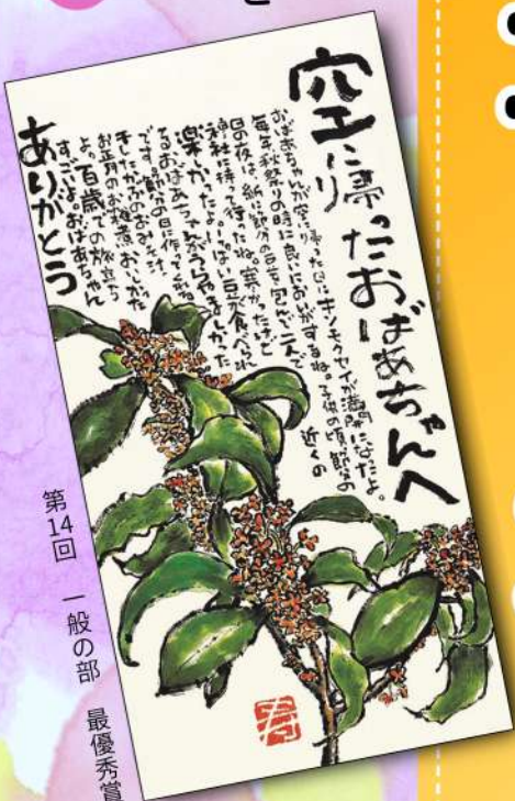
第14回 一般の部 最優秀賞