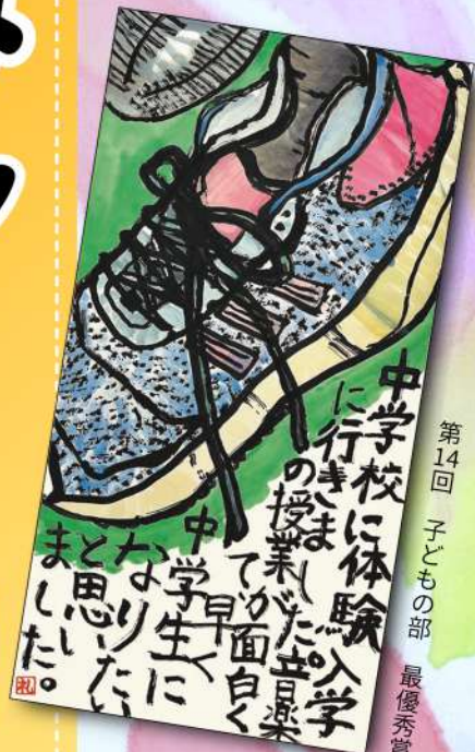
第14回 子どもの部 最優秀賞