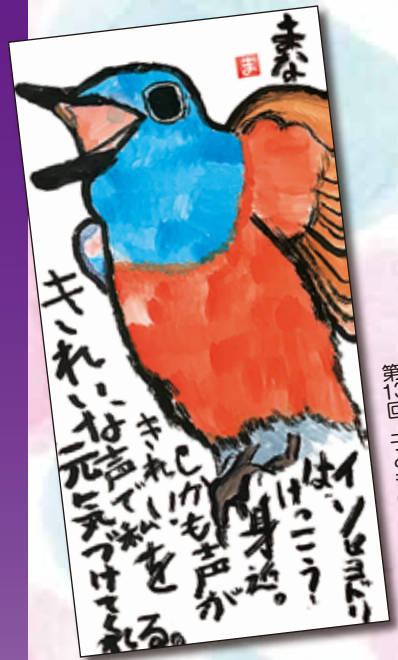
第13回 子どもの部 最優秀賞